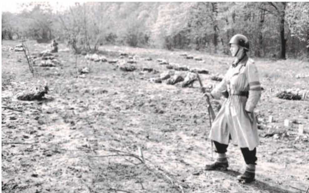
Efter befrielsen i maj 1945 fandt man 202 lig på det militære øvelsesareal i Ryvangen. Det var her, tyskerne henrettede danske modstandsfolk. På billedet herover står en modstandsmand vagt ved gravene. Området blev senere indrettet som Mindelunden (billedet th), som blev officielt indviet den 5. maj 1950.