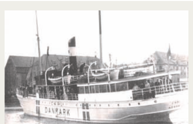
'Carl af Neksø' var en af de dampere, der blev brugt til at smugle illegale ud af Danmark.